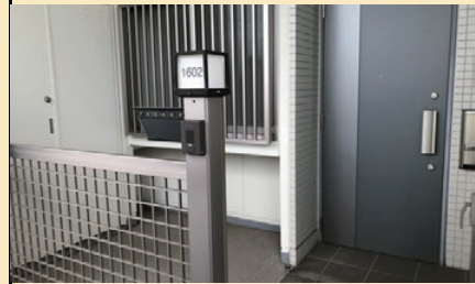
独立した玄関ポーチ