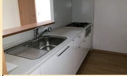
3口コンロのシステムキッチン