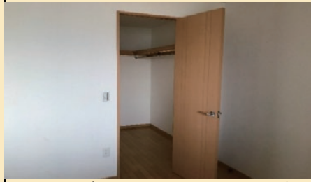
広々としたウォークインクローゼット