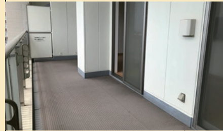
10m以上のワイドバルコニー