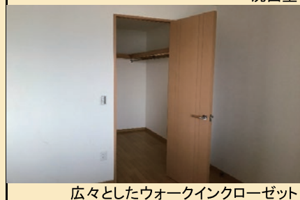
広々としたウォークインクローゼット