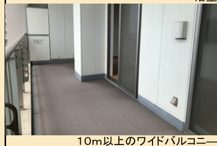
10m以上のワイドバルコニー