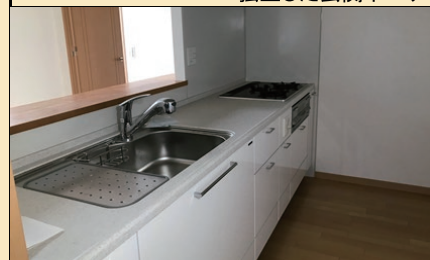
3口コンロのシステムキッチン