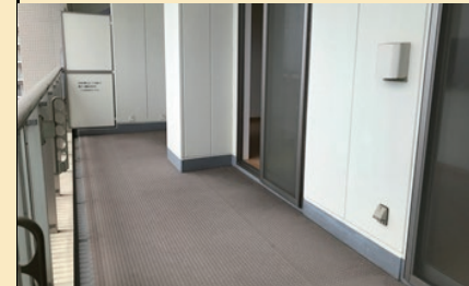
10m以上のワイドバルコニー