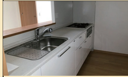
3口コンロのシステムキッチン